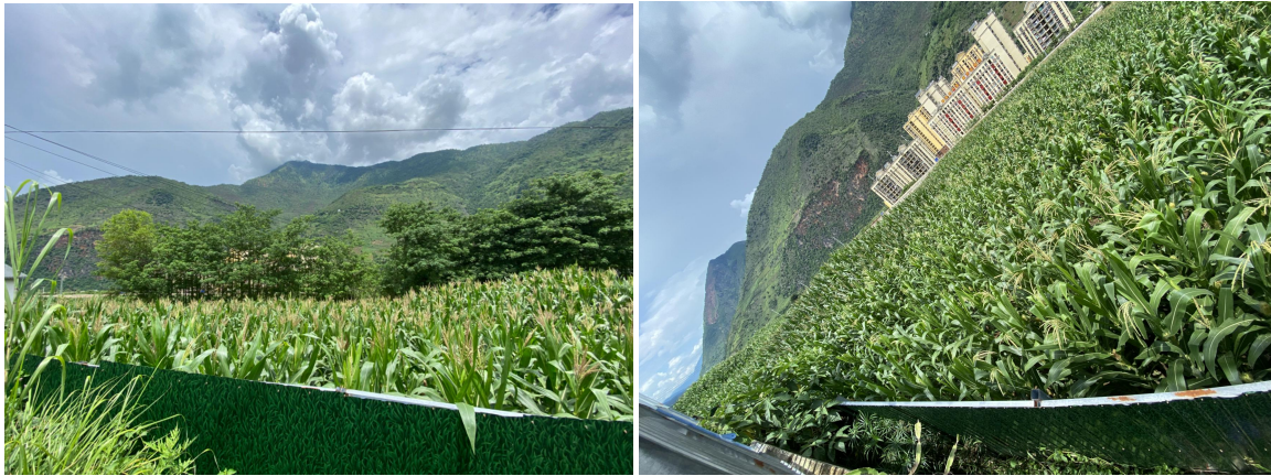
图 1：上江镇围挡的已征收土地现场图

四是项目主管单位泸水市土地收购储备发展中心针对债券资金开立了专用存款账户，用于核算债券资金的收款及拨付，债券资金的拨付有完整的审批程序和手续。但经评价小组对项目实地进行调查时，发现上江镇财政所已将青苗补偿款已拨付至农户，但围挡的已征土地上依然还种有成片的农作物。现场调查情况详见下图：