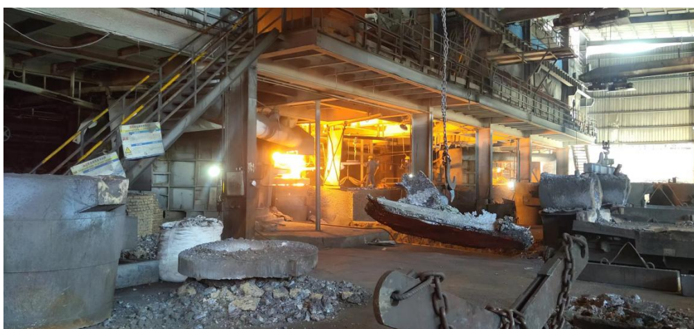
图 4 隐患企业问题排查-2