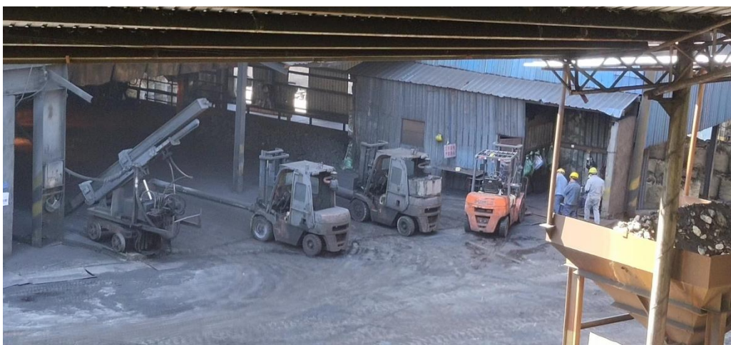
图 3 隐患企业问题排查-1

理水平，切实保障人民群众生命财产安全和社会经济平稳。工贸行业监管方面，泸州市应急管理局成立工作专班，深入开展工业硅专项检查和工贸行业“百日清零行动”安全监管，共查出问题和隐患 36 项，立案查处 34 项，下达《责令限期整改指令书》7 份，《行政处罚决定书》13 份，处罚罚款共计 16.453 万元。通过聘请安全技术服务机构开展工贸行业三级巡查四级预警工作，引进第三方参与安全生产隐患排查。