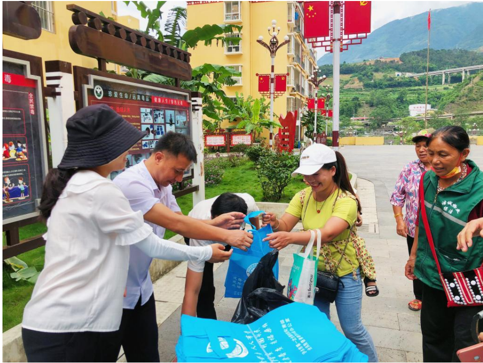
图 2 安全生产宣传“进社区”

二是加强了重点领域安全监管。非煤矿山监管方面，泸水市应急管理局印发《泸水市安全生产委员会关于印发泸水市非煤地下矿山及尾矿库政府领导安全生产包保责任制的通知》，全面落实政府领导安全生产包保责任；全面深入开展非煤矿山领域打非治违工作，联合自然资源局等部门先后开展 5 次非煤矿山领域大检查行动。会同自然资源、水利、林草、生态、工科、大练地街道办等 11 个部门依法关闭 1 座采石场。危险化学品监管方面，泸水市应急管理局制定《泸水市危险化学品安全风险集中治理实施方案》，在全市范围内开展危险化学品专项整治工作。烟花爆竹监管方面，泸水市应急管理局积极督查企业加大信息化建设力度，实现全市烟花爆竹储存运营达到省级二级标准化、信息化管