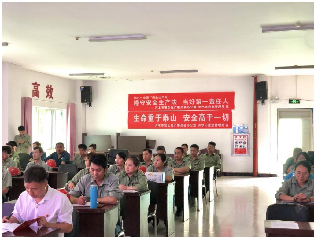
图 1 安全生产宣传“进企业”

活动，有效宣传了安全生产和防灾减灾知识，增强了群众安全意识和防范应对灾害风险的能力。全年共发放各类安全宣传、防灾避险等资料 8.7 万余份，累计约 1 万余人次参与宣传。